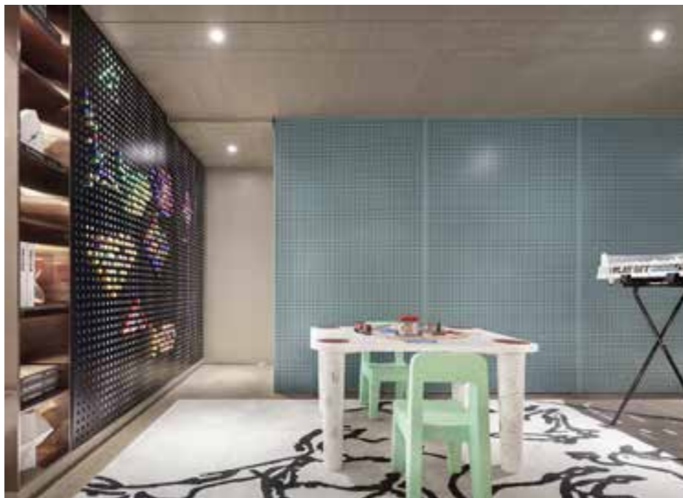
项目名称 | 皖投万科天下艺境亲子样板间 项目地点 | 安徽省 合肥市 设计公司 | One House Design 壹舍设计 摄影师 | 张骑麟

步入地下室，高挑空的结构尽显开阔与层次，这里也是能为每位家庭成员制造快乐记忆的场所。材质上冷暖结合、刚柔并济，视觉上纵横有序、流动自如。嵌入式酒柜在隐形灯带的衬托下愈发精致，畅谈相聚、品酒作乐的喜悦随之氤氲开来。酒柜两侧可通往茶室、健身房，背后更是别有洞天，整体功能布局极为丰富。