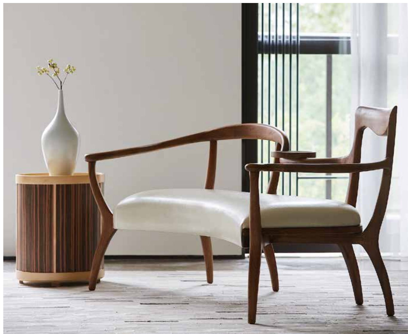
合肥万科城市之光别墅样板间局部 壹舍设计公司设计作品